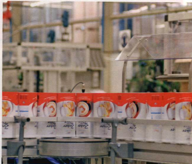
Links: Für die Feinzucker-Siegeldose wurde eine nagelneue Produktionsanlage installiert.