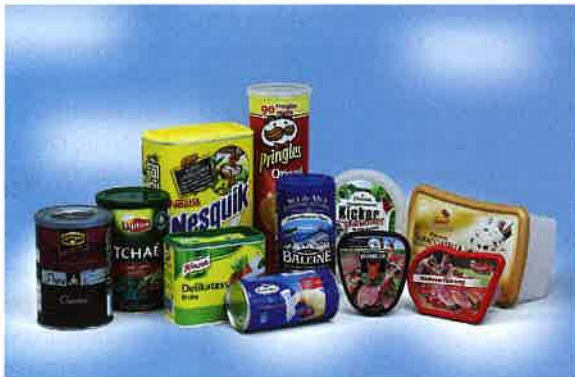
Kombidosen und innovative IML-Verpackungen.

sungen, wie eine Mühle für Puderzucker: Hierbei wurde aus der klassischen Dose ein gebrauchts- und tischfertiges Utensil, das nicht nur das Umfüllen des Produktes, sondern auch den Einsatz eines Siebes überflüssig macht.