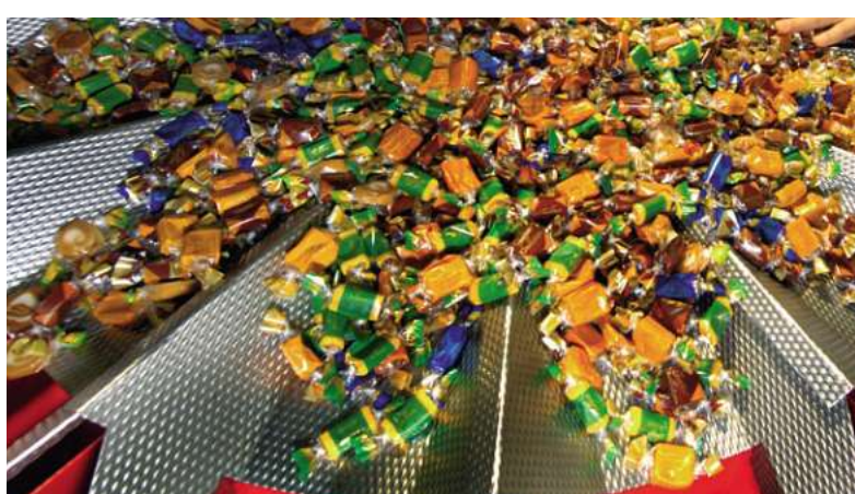
Süße Massen: maschinelle Verpackung von Karamellbonbons

Zeit zum Ausruhen gibt es aber nicht. „Um den wechselnden Anforderungen des Verpackungsmarktes gerecht zu werden, müssen die Verpackungsmaschinenhersteller kontinuierlich innovative Maschinenkonzepte anbieten“, so der Analyst. Derzeit „leidet die Branche insgesamt unter den hohen Herstellungskosten der Anlagen, dem wachsenden allgemeinen Preisdruck durch internationale Wettbewerber, außerdem drückt der schwache Dollar auf