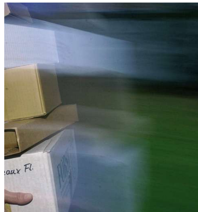
Hightech in Pappkartons: Mit intelligenten Verpackungen wollen die deutschen Hersteller von Packmaschinen ihren Spitzenplatz in der Welt verteidigen.